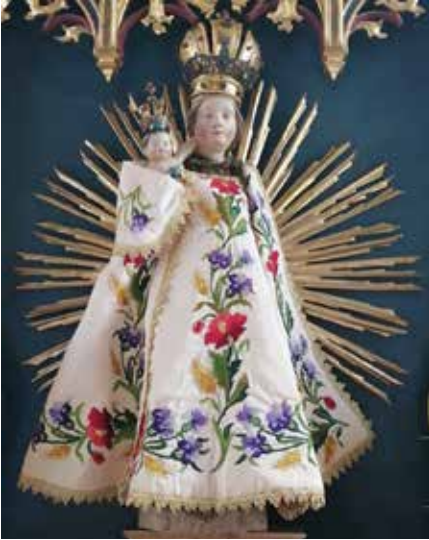
Loretto Muttergottes Ried