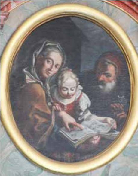
Pfarrkirche Prutz Seitenaltar