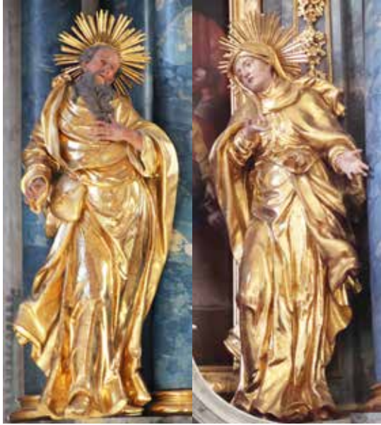
Pfarrkirche Ried: Joachim und Anna

zählungen über das Leben und Wirken Jesu), sondern vielmehr um einen Legendenkreis. Die von einem unbekanntem Autor mit dem Pseudonym Jakobus zusammengestellten Legenden befassen sich unter anderem mit der wunderbaren Geburt Marias als Tochter von Anna und Joachim, ihrer Jugend als Tempeljungfrau in der Obhut der Priester Jerusalems und ihrer Verbindung mit Josef. Das Protoevangelium des Jakobus gehört nicht zur Bibel, man ordnet es bei den apokryphen (außerbiblischen) Schriften ein. Dazu gehören auch das Kindheits-evangelium nach Thomas und das Pseudo-Matthäus-Evangelium, das erst im Frühmittelalter bzw. im 7. Jahrhundert