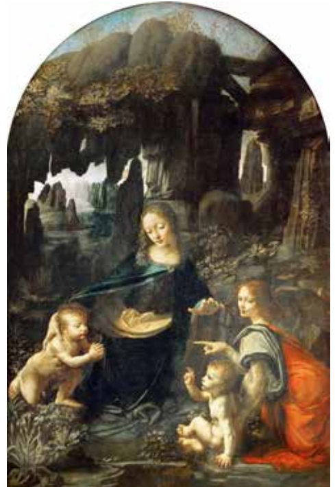
Leonardo da Vinci

nach Christus entstand. Beide beschreiben die Kindheit Jesu bis zum zwölften Lebensjahr. Die Zahl dieser Apokryphen (außerbiblischen Texte) wird auf mindestens hundert geschätzt. Sie vermitteln uns einen Einblick in das damalige volkstümliche Christentum in und außerhalb der Kirche. Die apokryphen Schriften könnte man teilweise als fiktional, romanhaft-fantastische Literatur bezeichnen. Für die bildende Kunst boten sie eine hervorragende Ausgangslage. Auch Leonardo da Vincis Gemälde Felsgrottenmadonna basiert auf einer Textstelle im Protoevangelium des Jakobus.